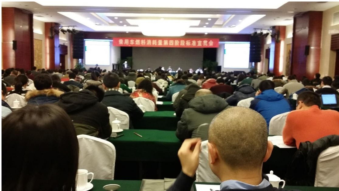
乘用车燃料消耗量第四阶段标准宣贯会，2015年1月21日，北京

2015年1月21日上午召开了标准宣贯会，标准牵头起草单位中国汽车技术研究中心、标准归口单位国家标准化委员会以及标准实施管理单位工业和信息化部负责人对标准制定、管理实施、未来计划进行了介绍并答疑。本政策简报将就宣贯会各方观点进行总结，及 iCET 在企业平均燃料消耗量 (CAFC) 在目标实施以及积分结转与交易政策方面的观点与建议，更多 iCET 观点请点击下载 2014年中国乘用车燃料消耗量年度报告 。